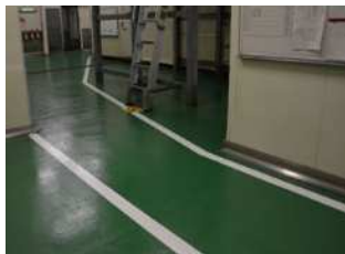
工場内の床が油で 滑って危ない・・・