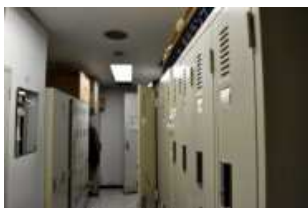
女性専用の更衣室を 設けたい!