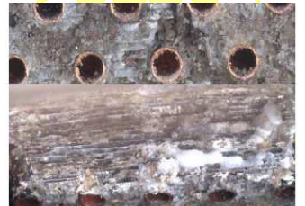
オイルミストで空調機の 熱交換器が劣化する・・・