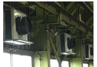
工場内が40℃を越えて 暑い・・・