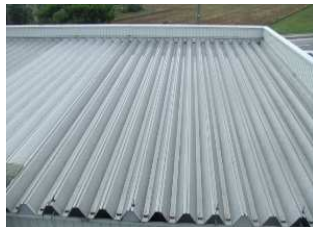
屋根から熱が入ってきて、 とにかく暑い・・・