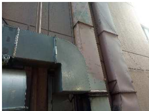
工場内の熱の換気や排気が うまくいっていない・・・