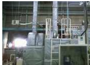
工場内の熱源で 作業環境が暑い・・・