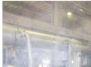
オイルミストや油煙の 充填を改善したい!