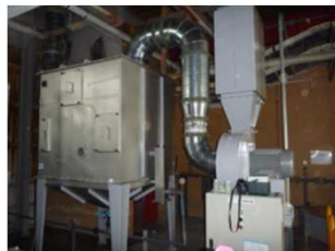
高温・有害ガスの排気や 集塵がうまくいっていない・・・