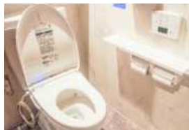
女性トイレを今より キレイにしたい!