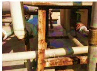
強酸雰囲気や鉄骨や 架台・タンクが錆びる・・・