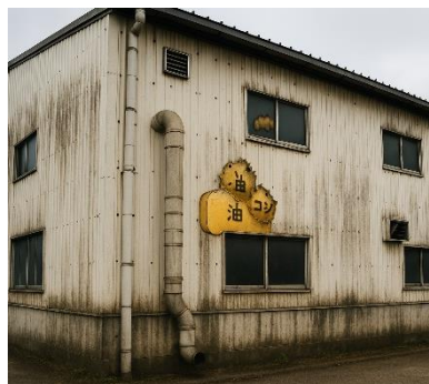
外壁が汚れやすく、 美観の維持が困難