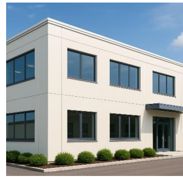
美観を保ちたいが、 方法が分からない

光触媒塗料はセルフクリーニング効果によって劣化を抑え、 一般的に 15～20 年の耐用年数 があるとされています。 その結果、大規模修繕の周期を延ばし、 ライフサイクルコスト を低減できます。