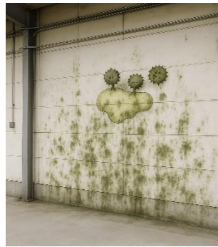
湿気が多く、常に カビが発生する壁