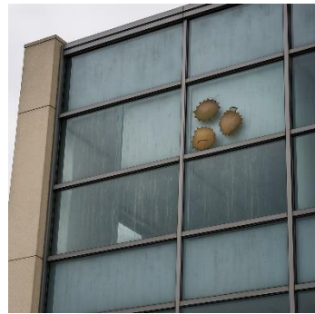
高所のため、日常的な 清掃が困難