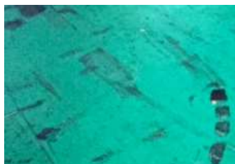
塗装してもすぐに 床が汚れる