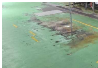
塗装しても油で すぐに剥がれた