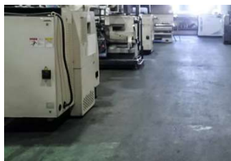
床の油汚れがひどくて 塗装できない