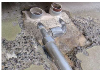
コンクリートが クラック・欠損している