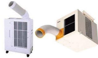
スポットエアコンでは 空調が足りない