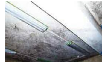
結露や湿度が原因で カビが発生している