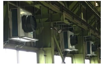
工場内の換気や排気が 足りていない