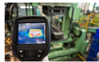
乾燥炉などの熱源の 放熱で暑い