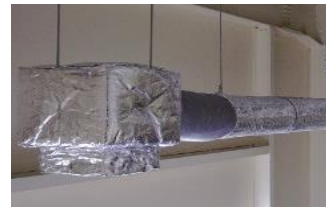
冷房の吹き出し口が 結露して水滴がたれる