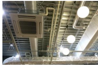
天井が低い ため熱を感じやすい