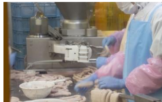
湿度が高くて製品が カビやすい