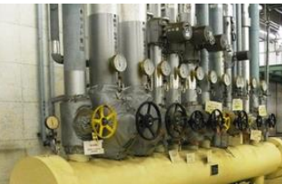
熱源が断熱できて いなくて熱い