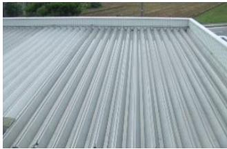
屋根から熱が入って きて暑い