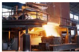
オープン型の炉が あって作業環境が暑い