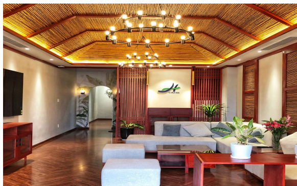
ゆったりくつろげる一階ロビー