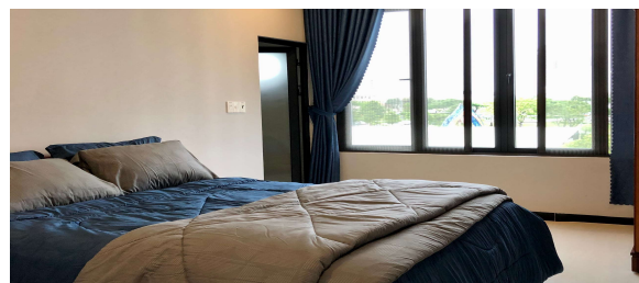
ご宿泊いただけるゲストルーム