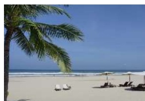
パウダーサンドの砂浜で有名な ノンヌックビーチ (ダナン市内から車で15分)