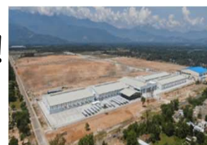
日系企業が関心を寄せる チャンマイ工業団地