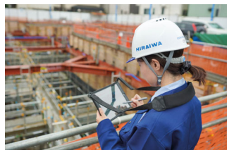
建設現場で活躍する女性たち

「エリア全体の再開発を行う場合、商業施設、住居、病院、オフィス、学校など、様々な施設の複合的な配置を検討しながら進めるため大規模な工事が必要となります。ですので、私たちのような建設ビジネスにとって、今は良い状況