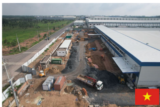
ベトナムでの工場建設

埼玉県所沢市に本社を置く平岩建設は、地域の老朽化した建物の建替えや、インフラの整備事業に大きな役割を果たしている建設会社である。1953年に設立された同社は、同国の自然災害に対する建物及びインフラの耐久力を最大化するという点でも大きく貢献している。