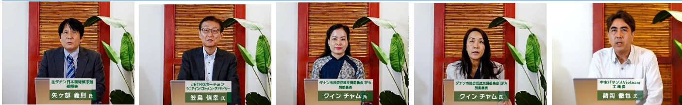
在ダナン 日本国総領事館様